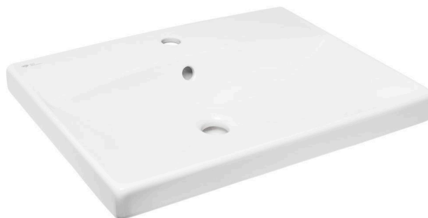
Ukázka 4: Keramické umyvadlo