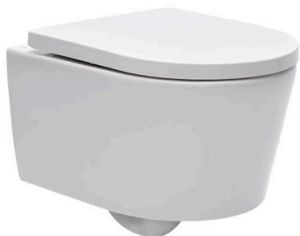
Ukázka 3: Závěsná toaleta